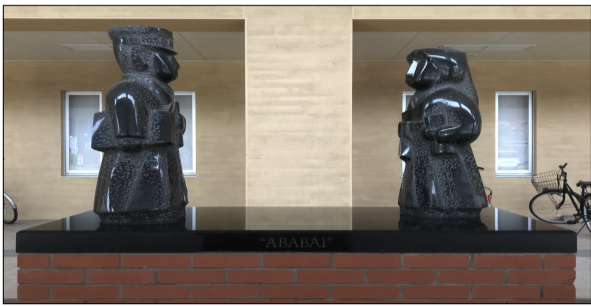
城南のシンボルアババイ像

ばの団学わるを一徒ろもS一スはの祭 い名訓一し目で ら思結年れ °楽城はは行は大トFラで城るのの自きを創城 しいしをる学し南一数つ全イI Sスある南。生も主高迎立南 い出、問行校み祭年少て国ベムつアを一校 徒と自校え1高 もにそわ事全にーにないのンーア飾南の が、立でる4校 の残れずで体しの一いる高トとィを城南の 通8ーあ由5は をるぞ一はでて開度 °と校 °いやる祭文 つ3のる緒周今 作すれ致、行い催の生こでFうIのー化 て0校 °正年年