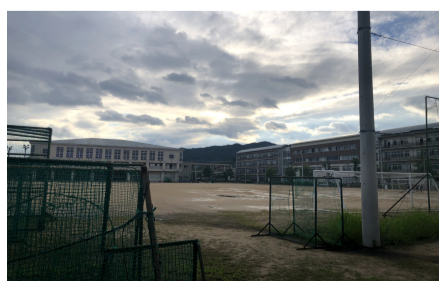
グラウンドから見た城南高校

Q1、城南高校ならではのところは？ 地域の皆さんに愛され、色々と考えて活動できているところ、バランスがとれているところ。 Q2、城南高校の好きなところは？ グラウンドから見る校舎と眉山のコントラスト。 Q3、通っていた頃と変化したところは？ 皆が真面目になったところ。 Q4、通っていた頃と